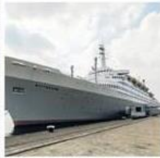
Hoera voor de SS Rotterdam...